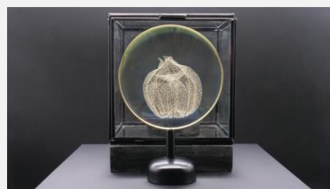
« Still Life ». Nature morte, composition française début XXI ème siècle. 15 cm x 15 cm x 15 cm.